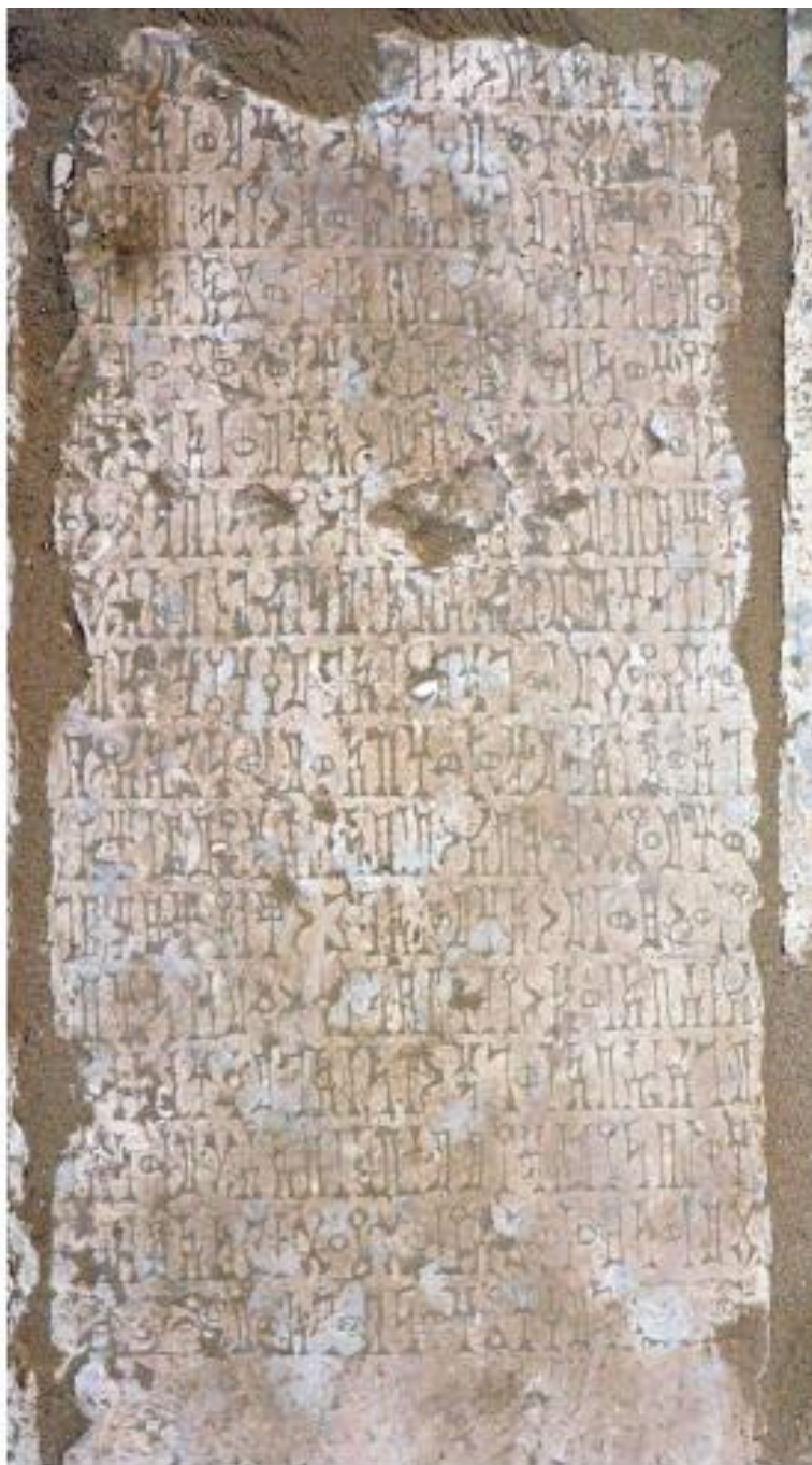
(لوحة: ٢) عريش ٢