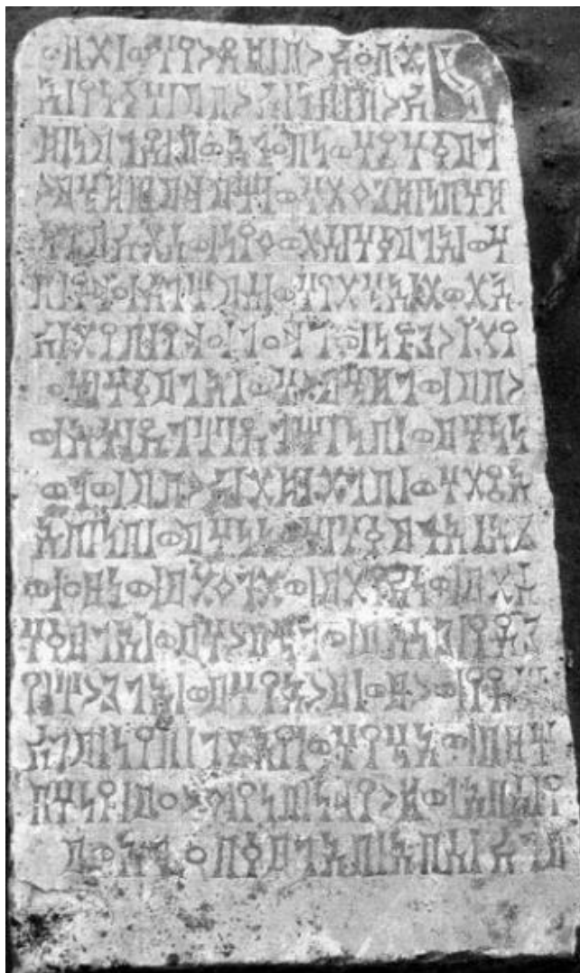
(لوحة: ٣) (MB 2005 1-56)