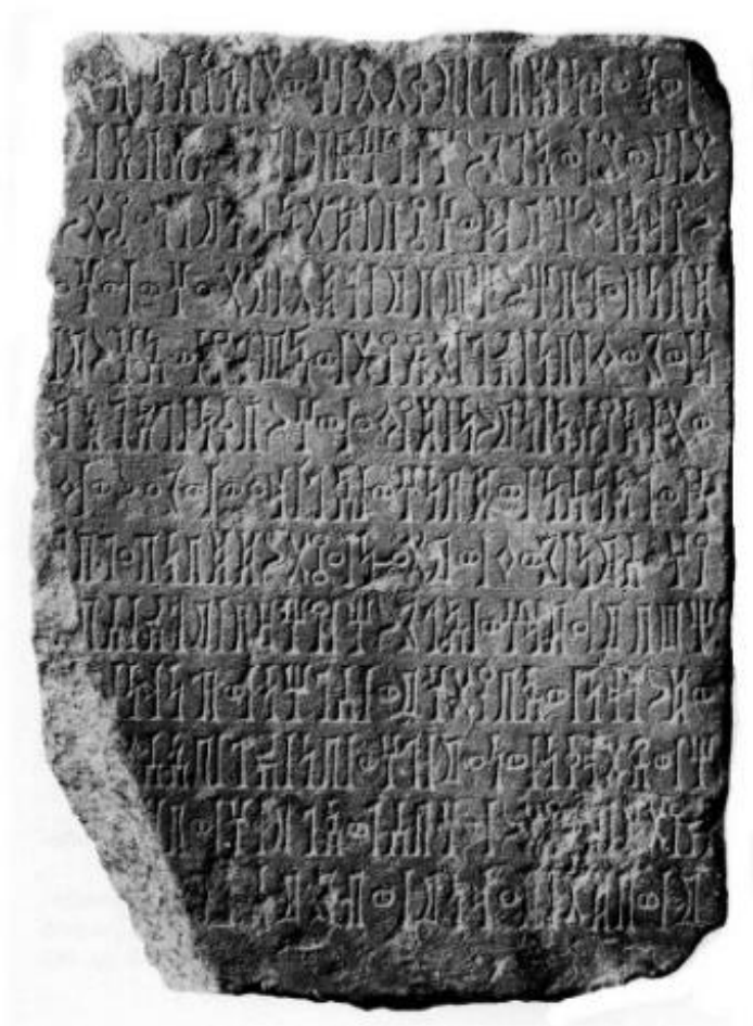
(لوحة: ٤) (CIH 429)